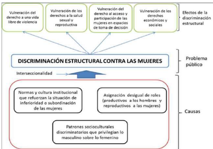
Gráfico 1 Causas y efectos del problema público

Elaboración: MIMP. Dirección General de Igualdad de Género y No Discriminación.